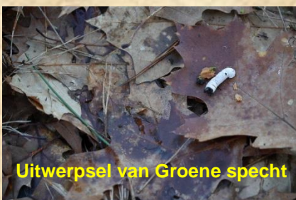
Uitwerpsel van Groene specht