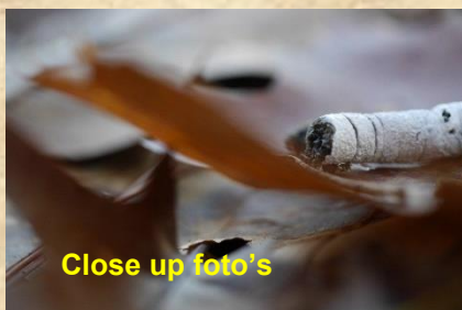
Close up foto's