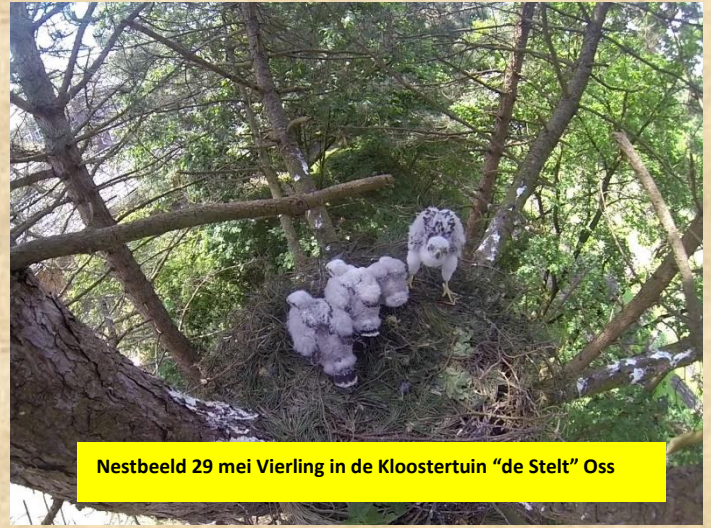
Nestbeeld 29 mei Vierling in de Kloostertuin "de Stelt" Oss