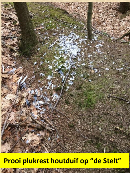
Prooi plukrest houtduif op "de Stelt"