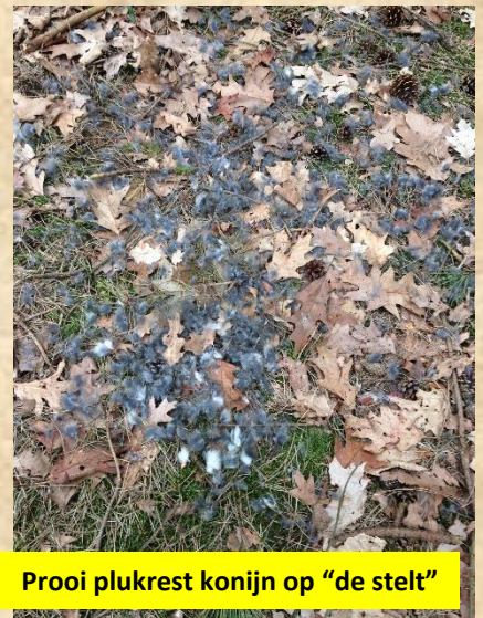
Prooi plukrest konijn op "de stelt"