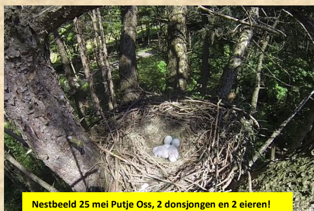
Nestbeeld 25 mei Putje Oss, 2 donsjongen en 2 eieren! Waarschijnlijk 1 ei en 1 lege eierdop.

Om aan te geven dat je snel op het verkeerde been wordt gezet. Deze onderstaande twee foto's van het zelfde nest van 't Putje Oss. 8 dagen verschil in opname. Zie ook de verse nestbekleding. Dennennaalden tegen de parasieten worden regelmatig vers aangevoerd. Een havik houdt zijn nest netjes oude prooiresten worden afgevoerd.