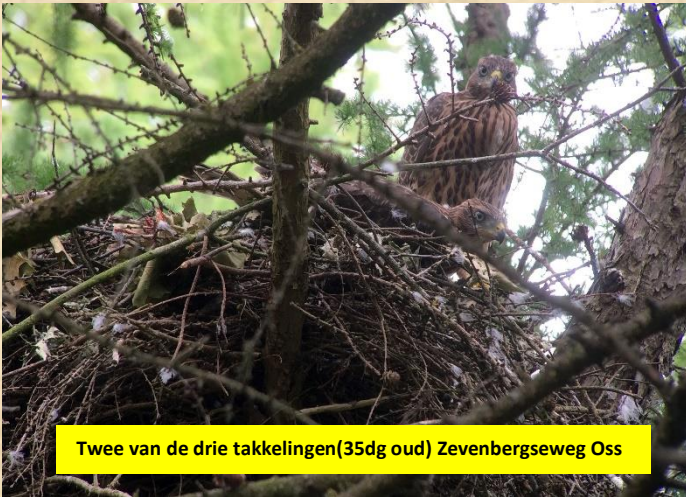
Twee van de drie takkelingen(35dg oud) Zevenbergseweg Oss

De havik aan de Zevenbergseweg is een echte duivenspecialist. Ik tel zo vijf postduiven ringen. Zie foto.