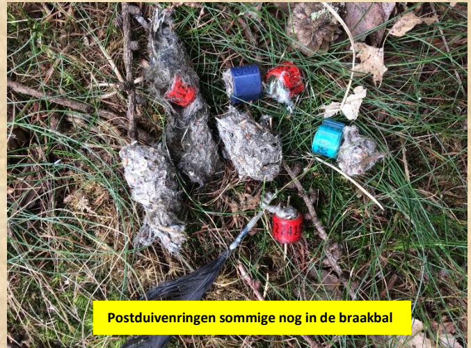
Postduivenringen sommige nog in de braakbal

Ook het hoge nest op de Snippenjacht is niets te zien, wel een poepcirkel. Het zijn ook nog donsjes die in de nestkom liggen. Het vrouwtje zit in haar uitkijkboom een geringde Amerikaanse eik. Hier hoor ik de goudvink roepen. Het tweede nest noordelijk is dit jaar niet in gebruik.