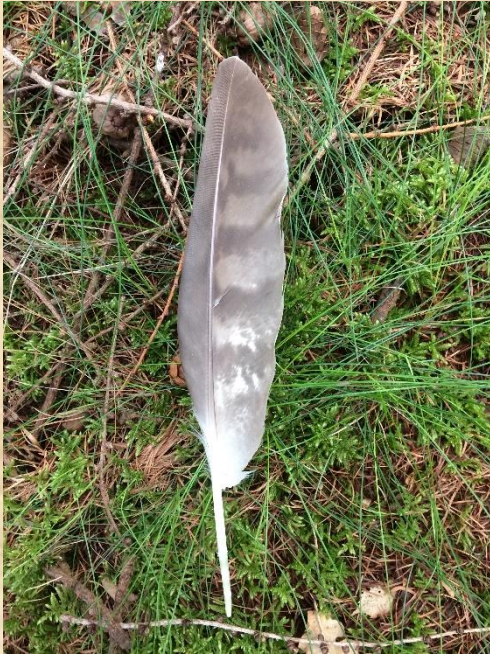
Havik HH11 Ganzenven

Van de negen havik paren zeker zes broedend en twee nog onduidelijk. De havik van de Kanonsberg is nog niet terug gevonden misschien heeft dat hier te maken met de Raven.