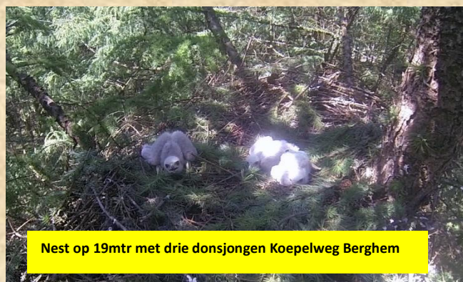
Nest op 19mtr met drie donsjongen Koepelweg Berghem