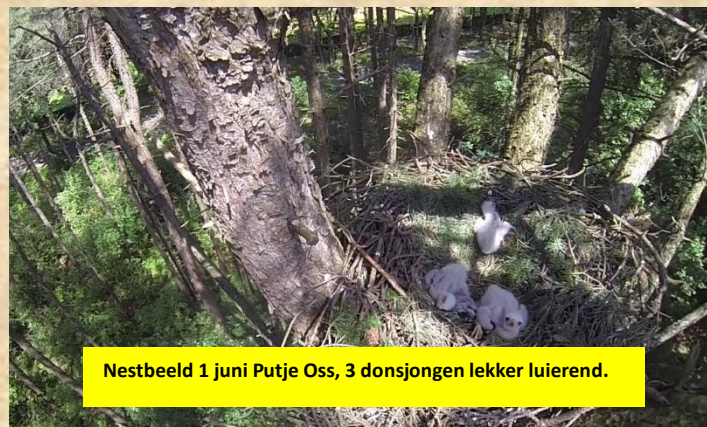
Nestbeeld 1 juni Putje Oss, 3 donsjongen lekker luiierend.