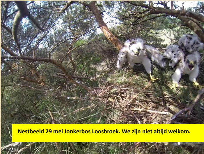
Nestbeeld 29 mei Jonkerbos Loosbroek. We zijn niet altijd welkom.