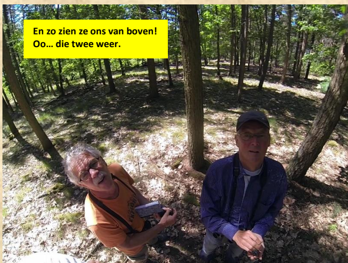
En zo zien ze ons van boven! Oo... die twee weer.