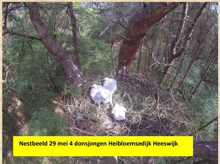
Nestbeeld 29 mei 4 donsjongen Heibloemsedijk Heeswijk