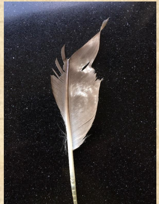
Sperwer Hooge Vorssel