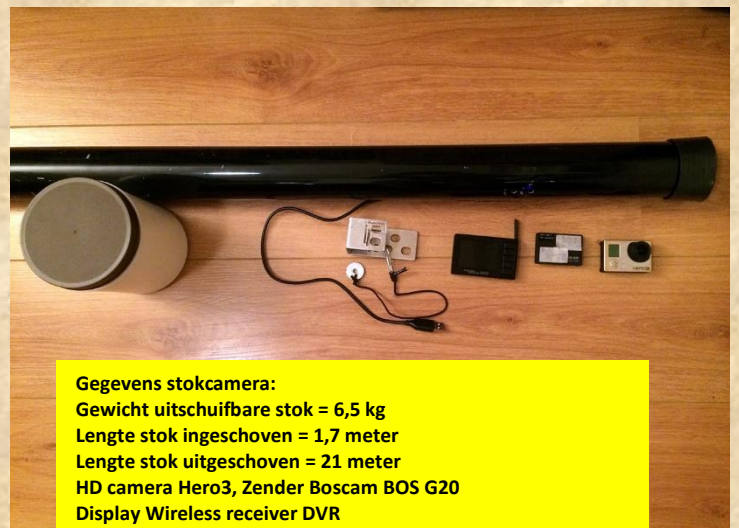
Gegevens stokcamera: Gewicht uitschuifbare stok = 6,5 kg Lengte stok ingeschoven = 1,7 meter Lengte stok uitgeschoven = 21 meter HD camera Hero3, Zender Boscam BOS G20 Display Wireless receiver DVR

Het volgende verslag zal gaan over de aangevoerde prooien. En het aantal uitgevlogen takkelingen. Deze gegevens worden overgenomen op de nestkaarten en opgestuurd naar het Sovon.