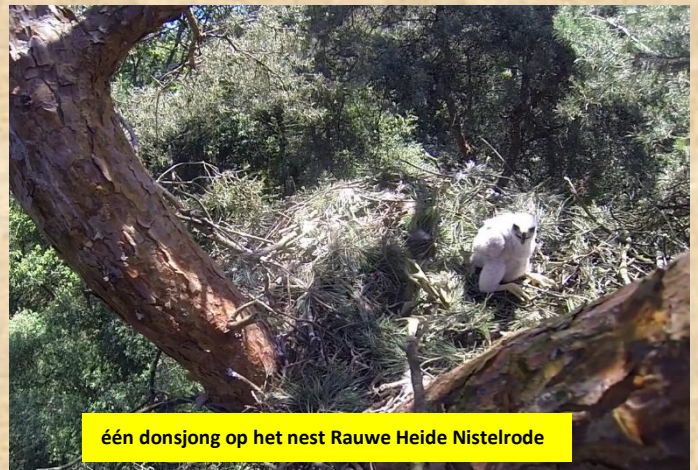
één donsjong op het nest Rauwe Heide Nistelrode

Vandaag met de stokcamera in het nest gekeken Rauwe Heide te Nistelrode, verrassend er zit maar één donsjong op het nest. Het waakzaam vrouwtje laat al snel van zich horen. Wat een geweldig nuttig werktuig deze stokcamera. Bij de Golfbaan hebben de vier jongen het nest verlaten ik hoor ze in de buurt roepen. Opvallend dit broedseizoen zijn de verschillen in leeftijd van de jongen. Sommige zijn toch later gestart met de eileg.