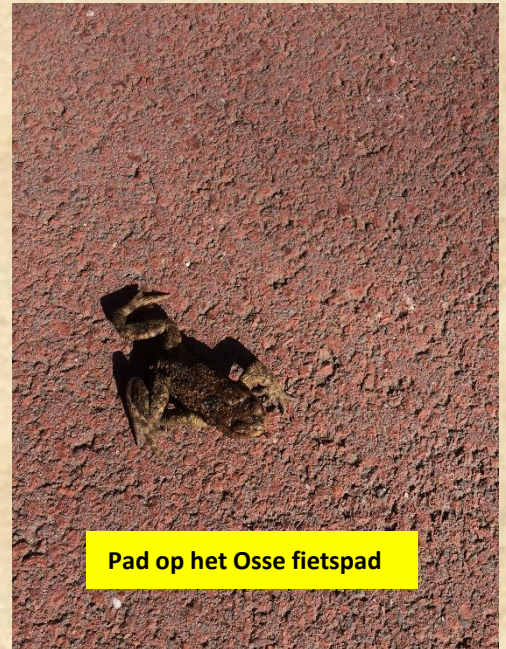
Pad op het Osse fietspad

Geen havik geluid en ook geen nest of verdere aanwijzingen. Hier kan ik hulp gebruiken van Paul. Volgende keer meer. Er is steeds meer activiteit in de kloostertuin. Wel meerdere zwevende buizerds in de lucht.