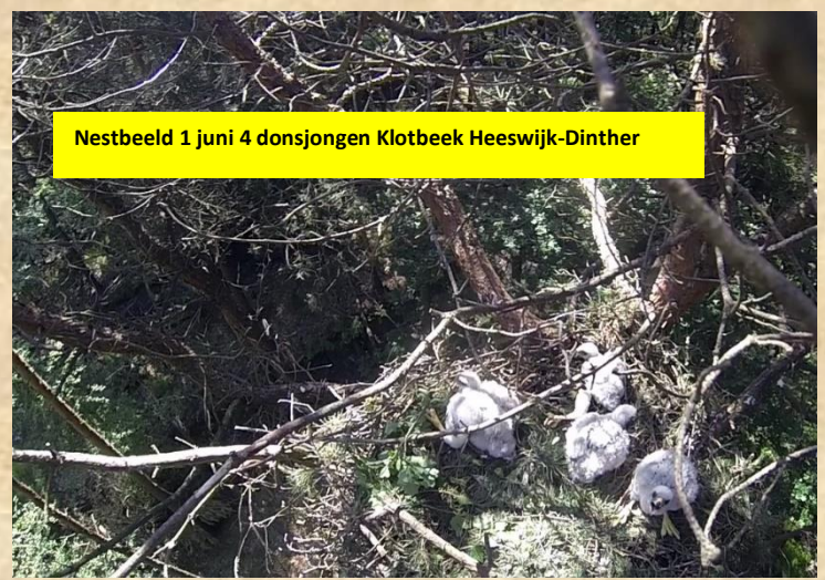
Nestbeeld 1 juni 4 donsjongen Klotbeek Heeswijk-Dinther