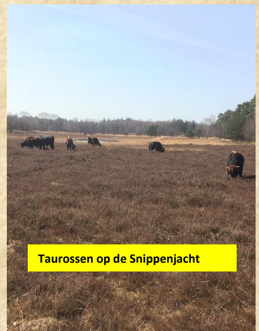
Taoussen op de Snippenjacht