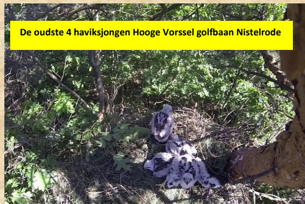
De oudste 4 haviksjongen Hooge Vorssel golfbaan Nistelrode

Om aan te geven dat je snel op het verkeerde been wordt gezet. Deze onderstaande twee foto's van het zelfde nest van 't Putje Oss. 8 dagen verschil in opname. Zie ook de verse nestbekleding. Dennennaalden tegen de parasieten worden regelmatig vers aangevoerd. Een havik houdt zijn nest netjes oude prooiresten worden afgevoerd.