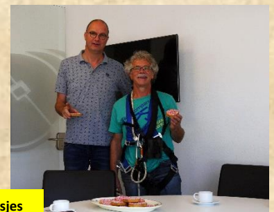
Beschuit met muisjes