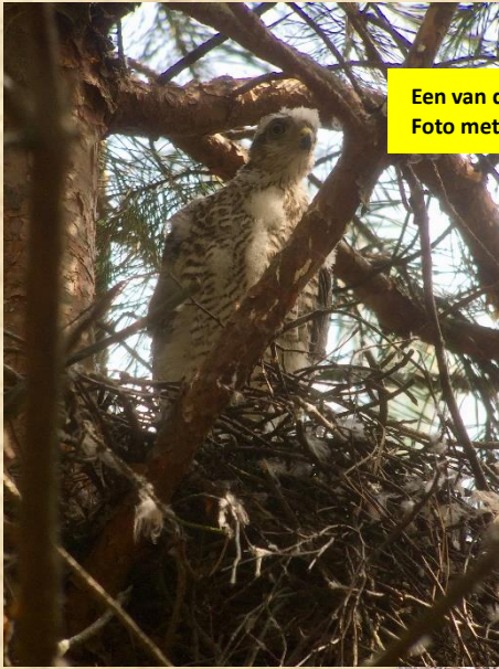
Een van de vier Sperwer jongen Bosweg H-Dinther Foto met iPhone door telescoop gemaakt.

Dit jaar volgden we twee succesvolle sperwers. De nesten zijn inmiddels verlaten maar de jongen worden nog wel gehoord in de omgeving van hun nesten. In dit verslag veel foto's van plukresten van typische plukplaatsen van de sperwers. Het op naam brengen van deze plukresten(veren en botjes) is best moeilijk. Gelukkig heb ik wat specialisten en websites wat betreft veren determinatie die ik kan raadplegen.