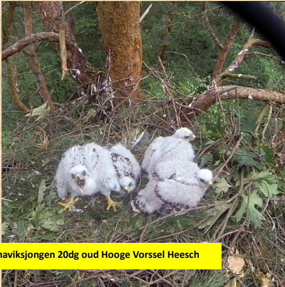
Vier haviksjongen 20dg oud Hooge Vorssel Heesch