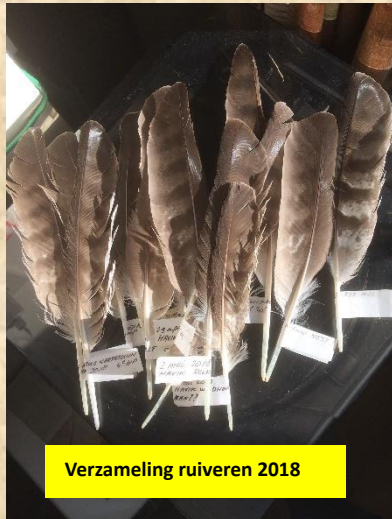
Verzameling ruiveren 2018