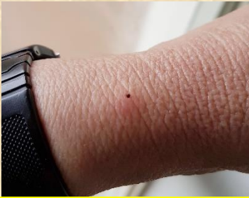
Ook weer de eerste teken voor Paul!

Verder ook weer de eerste teken. Dus het is thuis goed kijken na het douchen of je ze mee brengt.