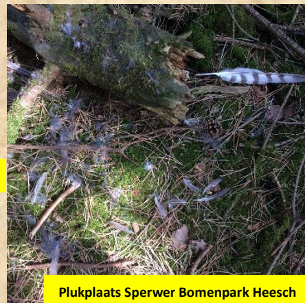
Plukplaats Sperwer Bomenpark Heesch