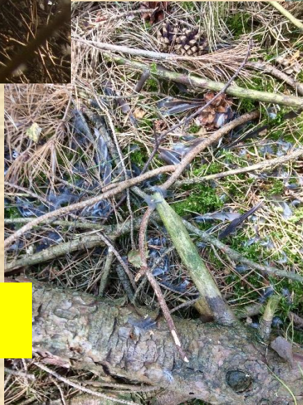
Uitzoeken van prooiresten een klusje voor koelere periode. Veertjes zijn in plasticzakjes verzameld.