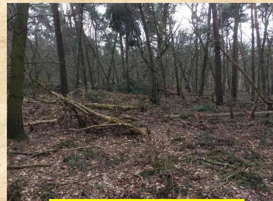
Stormschade in Heeswijkse bossen

6 maart Jonkerbos Loosbroek . Hier al volop havik activiteiten. Ze kekkert enkele keren. Maar ook de buizerd laat van zich horen. Dat gaat hier al jaren goed samen. Erg droog in deze bossen, sloten zijn leeg.