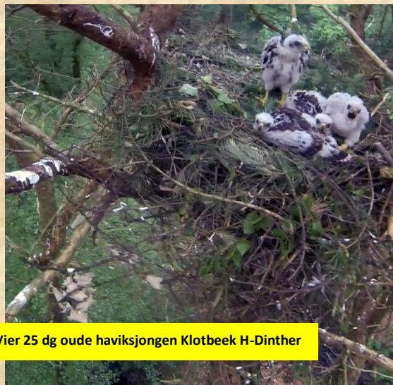
Vier 25 dg oude haviksjongen Klotbeek H-Dinther