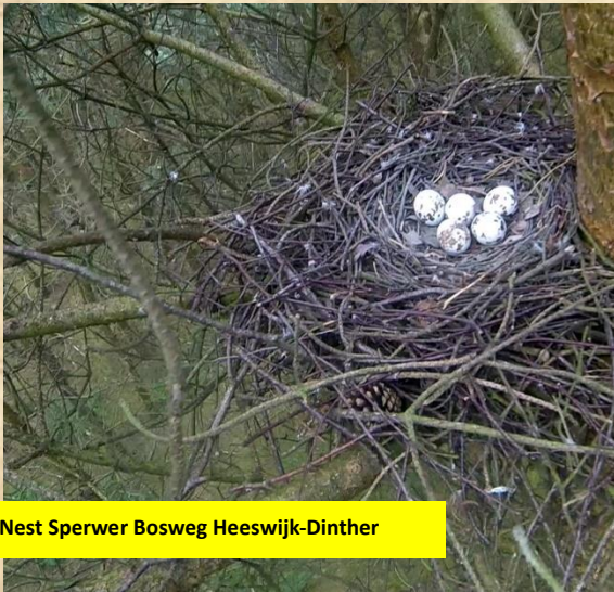
Nest Sperwer Bosweg Heeswijk-Dinther