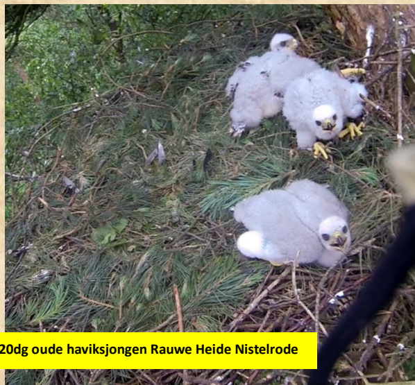
Drie 20dg oude haviksjongen Rauwe Heide Nistelrode