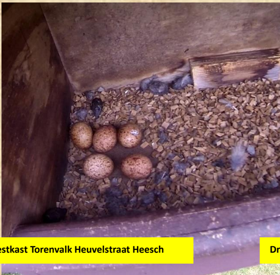
Nestkast Torenvalk Heuvelstraat Heesch