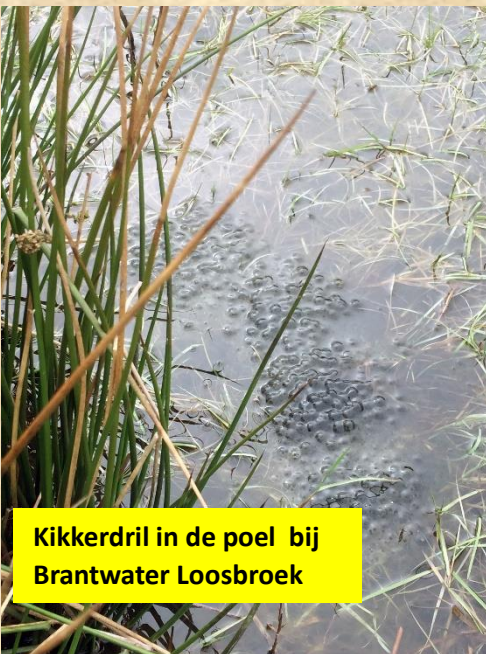
Kikkerdril in de poel bij Brantwater Loosbroek