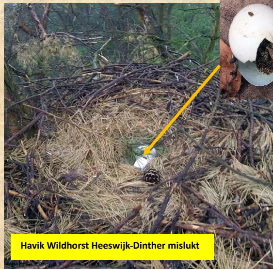
Havik Wildhorst Heeswijk-Dinther mislukt