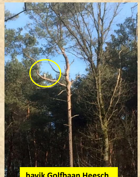
havik Golfbaan Heesch