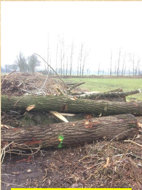
Havik territorium De Wielen