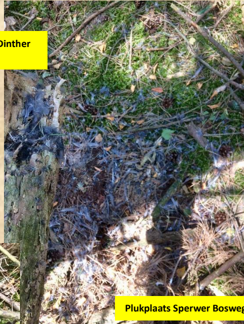
Plukplaats Sperwer Bosweg H-Dinther