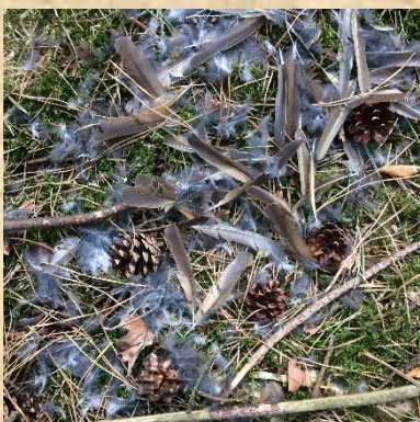
Plukplaats Sperwer Bosweg H-Dinther