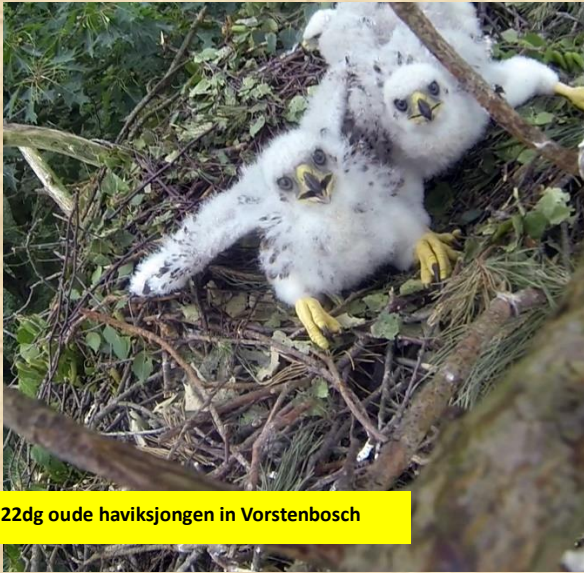
Drie 22dg oude haviksjongen in Vorstenbosch

Het volgende verslag zal gaan over de aangevoerde prooien. En het aantal uitgevlogen takkelingen. Alle gegevens worden overgenomen op de nestkaarten en opgestuurd naar het Sovon en naar WRN(werkgroep roofvogels Nederland)