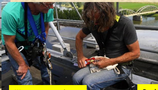
Wegen, meten en ringen