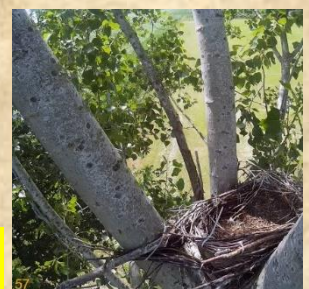
Het lege kunstnest 7 juni Ruitersweg-Oost Heesch

Het is nu zoeken naar nesten van de boomvalk. Langs de Ruitersweg in Heesch waar de boomvalk al meerdere jaren succesvol broedt hebben we het nest nog niet gevonden. Hij werd meerdere keren in deze omgeving gezien. Ook op het kunstnest toen de jonge kraaien net het nest hadden verlaten, waarneming Ank van Erp. Maar het nest is leeg als ik later met de camera kijk. Het is hier ook wachten op het moment dat we de jongen horen roepen. Nog een tip van jager Wilco Vesters nagetrokken, die vanuit zijn jagersstoel regelmatig een boomvalk ziet op Donzel in Nistelrode. Wordt vervolgd.