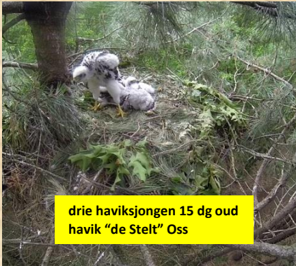
drie haviksjongen 15 dg oud havik "de Stelt" Oss

Een schuwe en eigenaardige havik. Vorig jaar een nieuw nest in een spar gevonden doordat de takkelingen met hun hongerroep de aandacht trekken. In het begin van het jaar de haviksvrouw daar ook horen roepen. Maar geen poepjes onder het nest als we met de camera gaan zoek, ook nog eens een moeilijk te benaderen nest. Ze is weer verhuisd? Wel ter plekke nu een ruiveer gevonden. En ook liggen er verse plukresten.