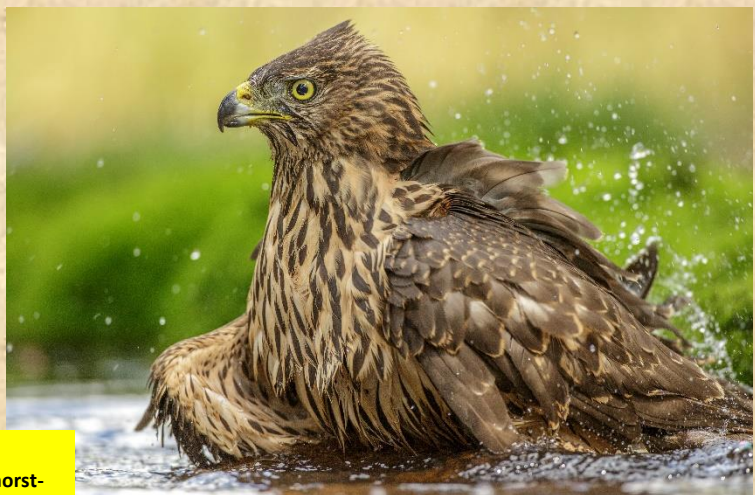
Foto : eind juli 2019 Juveniele havik Maashorst-Noord. Gemaakt vanuit de fothut Alexander van Buil.

Meer aan de randen van ons onderzoeksgebied zien wij nog geen terugval van het aantal haviken. Maar zelfs een uitbreiding. In de Geffense bosjes is een nieuwe vestiging van een havik. Nadat de plaatselijke buizerd de havik accepteerde werd er met succes drie jongen groot gebracht in het bosje aan de rand van Oss. De buizerd was ook succesvol met twee uitgevlogen jongen. Er waren muizen genoeg dit