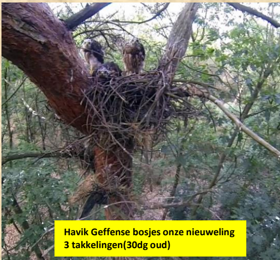
Havik Geffense bosjes onze nieuweling 3 takkelingen(30dg oud)