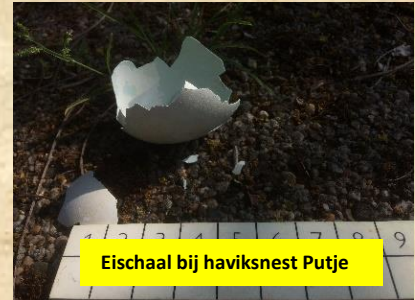
Eischaal bij haviksnest Putje

Harde wind, zomerstorm, code oranje. Hoe is het met de nesten? In dit verslag veel camerabeelden van de stokcamera. Zoals jullie al gelezen hebben in het verslag van Bernheze was het hard werken om alles in één dag te halen. Maar op een territorium na is de planning gehaald. Het is genieten van de positieve broedresultaat van onze haviken. Hieronder een schema met de ei legdatums en het aantal jongen per havik territorium. Ook nog extra informatie.