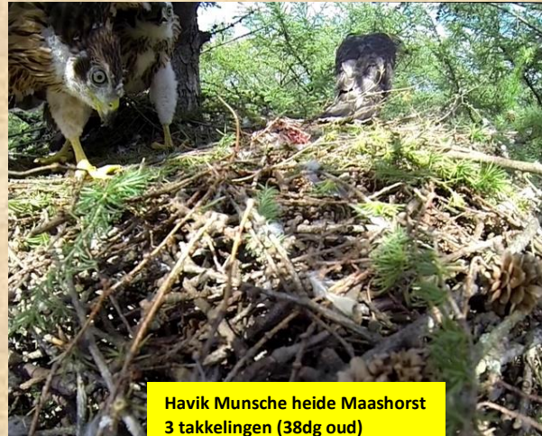
Havik Munsche heide Maashorst 3 takkelingen (38dg oud)

Dit was de laatste havik waar we met de stokcamera het nest wilde kijken. Na een fikse wandeling met de zware stokcamera(Paul) vanaf het honingvrouwtje(man) hebben we drie prachtige takkelingen inbeeld. Daar doen we het voor. Dit is havikspaar dat het nog goed doet in de nabijheid het ravenpaar.