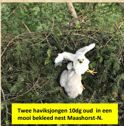
Twee haviksjongen 10dg oud in een mooi bekleed nest Maashorst-N.

Door de kou in maart zijn de haviken later met eileg begonnen. Zoals vermeld is er een redelijke correlatie tussen de eileg en de maartse temperaturen. De havik op "de Stelt" heeft de grootste jongen(15dg) en is op 2 april gestart met de eileg. De andere in dit onderzoeksgebied zeker een week later.