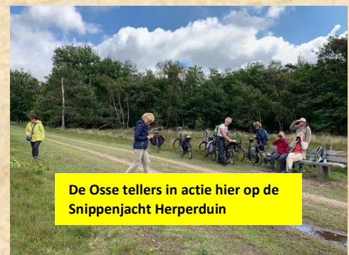
De Osse tellers in actie hier op de Snippenjacht Herperduin

Wij deden op zaterdag mee met ons vegetatie werkgroep Oss. Er werden 160 wilde planten ingevoerd. Ook werden er vogels geteld (35 soorten) door twee leden van de vogelwerkgroep Oss. Een mooi prestatie en een leuke dag. Uiteindelijk werden er 1023 soorten geteld een groot succes. Het natuurpark De Maashorst staat op de kaart.