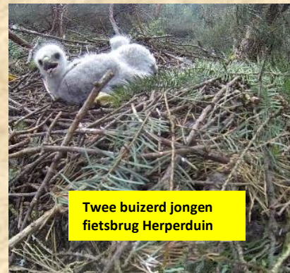
Twee buizerd jongen fietsbrug Herperduin

Vorig jaar voor het eerst een nest in een lariks aan de bosrand. Iets verder ongeveer dertig meter een buizerd nest. We krijgen nu een leeg haviksnest in beeld. Vorig jaar vlogen er vier jongen uit. Hier gaan we nog verder zoeken naar een eventueel nieuw nest. De buizerd is wel succesvol met twee jongen zie foto hiernaast.