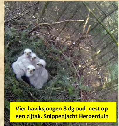
Vier haviksjongen 8 dg oud nest op een zijtak. Snippenjacht Herperduin