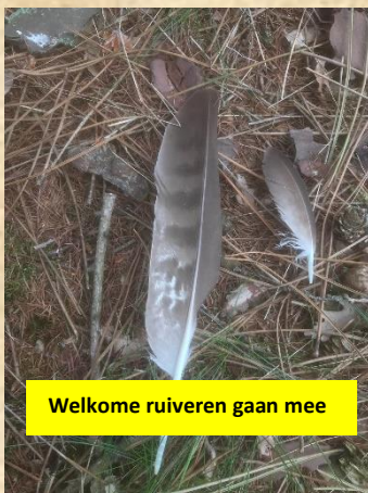
Welkome ruiveren gaan mee