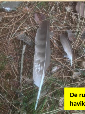
De ruiveer gevonden door Otto havik Munsche Heide Maashorst

Het nest van deze havik in een Douglasspar zit te hoog om met onze stokcamera in het nest te kijken. Dit jaar zal ik onze klimmer Jasper vragen.