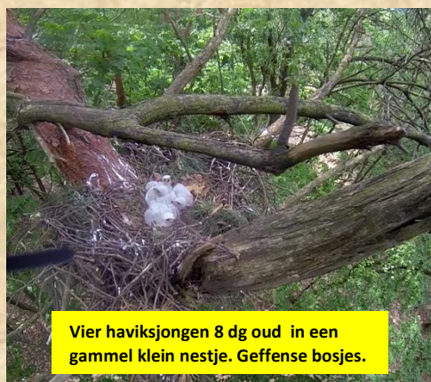
Vier haviksjongen 8 dg oud in een gammel klein nestje. Geffense bosjes.