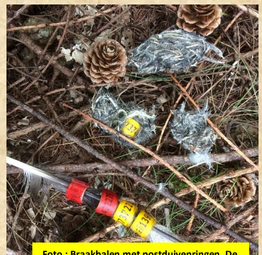
Foto : Braakballen met postduivenringen. De duif is een belangrijke prooi. Er worden de laatste jaren minder ringen gevonden.