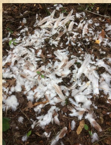
Foto : plukplaats van een geslagen duif. Koepelweg Herperduin. In Berghem zijn nog veel duivenhouders