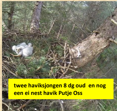
twee haviksjongen 8 dg oud en nog een ei nest havik Putje Oss