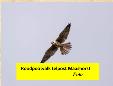
Roodpootvalk telpost Maashorst Foto

Droogte en felle zon met tropische temperaturen op het einde van juni. Ook vogels zoeken naar verkoeling. Dit levert mooie foto plaatjes op vanuit de fotohut op Herperduin. Ook roofvogels komen graag drinken of nemen een bad in het vijvertje voor de fotohut in Herperduin. Ik spreek met de beheerder van deze fotohut tijdens onze nachtzwaluw wandeling op de Kanonsberg. Ook haviken, rode wouw of wat te denken van wespindief komen voor de lens. Om jaloers op te worden deze mooie waarnemingen en mooie foto's. De nachtzwaluwen op de Kanonsberg op de Maashorst laten zich goed horen en zien. Prachtige zweefvluchten zien we. Dit zijn echt de zomerse zwoele avondgeluiden. De rugstreeppad en kevers doen zachter op de achtergrond mee.