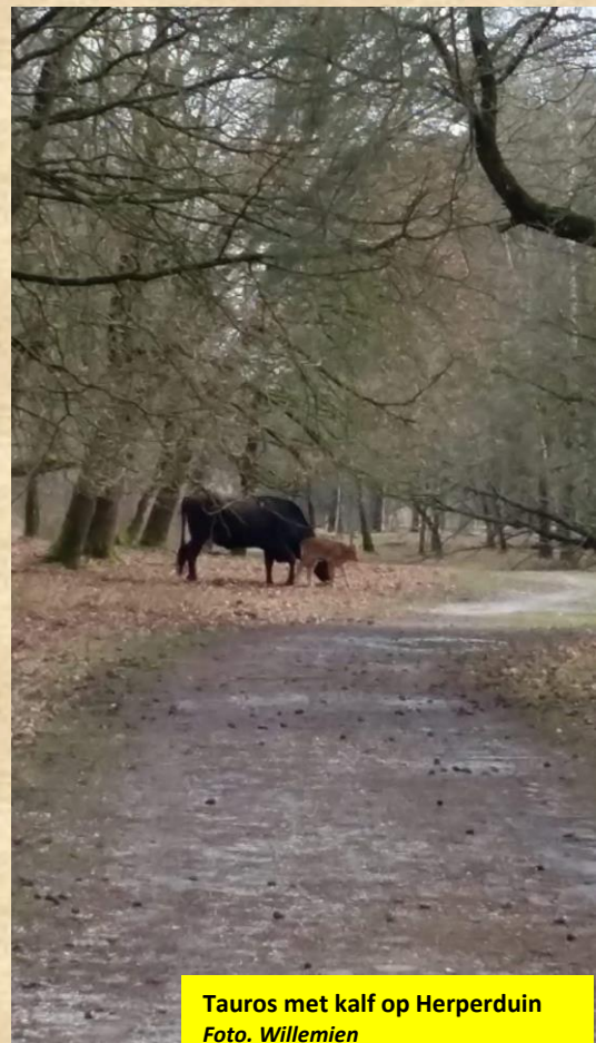
Tauros met kalf op Herperduin

Ja, een nieuwe havik heeft zich gevestigd in Oss. En wel in de Geffense bosjes. Paul had de havik een keer gehoord toen hij daar aan het wandelen was. Dat wil nog niet alles zeggen. Maar op 21 maart zag hij de havik in gevecht met een buizerd in de lucht, het leverde een nest op dat later van de buizerd blijkt te zijn. Op 2 april heb ik het jonge havik vrouwtje goed in de verre kijker als ze op de rand van het nest zit.