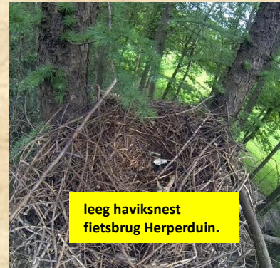
leeg haviksnest fietsbrug Herperduin.