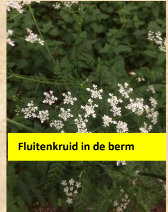
Fluitenkruid in de berm