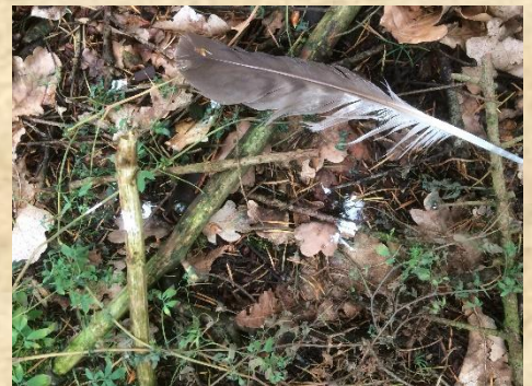
3 e ruiveer havik Maashorst NO tussen de poepjes