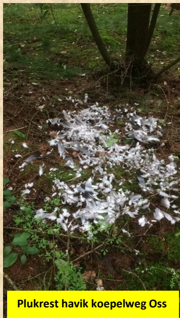
Plukrest havik koepelweg Oss