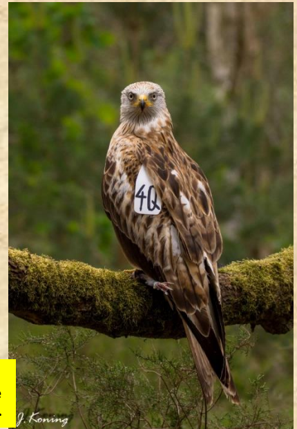
Foto : augustus 2019 Gemaakt vanuit de fotohut op de Maashorst via Alexander van Buil.