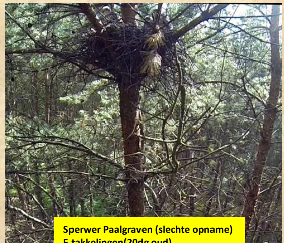
Sperwer Paalgraven (slechte opname) 5 takkelingen(20dg oud)

Hier vliegen en roepen jongen net uitgevlogen buizerds. Het nest niet teruggevonden.