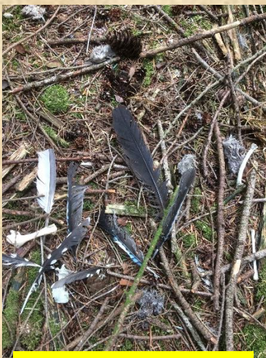
Foto : prooiresten/veren van Gaai, duif en grote bonte specht. Snippenjacht Herperduin.

Na controles zijn belangrijk om prooiresten te vinden. Lange tijd(augustus) na het uitvliegen worden de takkelingen nog op het nest gevoerd. Botjes, veren en verse braakballen worden over de nestrand gegooid. Deze prooigegevens worden verzameld en op de nestkaarten verwerkt. Hieronder enkele voorbeelden. De veren site https://www.featherbase.info/nl/home is een goed hulpmiddel om de veren op naam te brengen. Ook is er een forum voor vragen over veren.