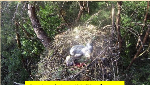
Twee jonge buizerds 10dg (25 mei) Rijsvennen Herperduin