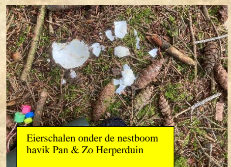
Eierschalen onder de nestboom havik Pan & Zo Herperduin

Deze havik heeft hoog zijn nest in een douglasspar. In het drukste gedeelte van Herperduin. Maar van deze recreanten schijnbaar geen overlast. Wel was het schrikken met het vinden van eierschalen onder de nestboom. Ook hangt er aan een kant van het nest een hele pluk dons uit. Onduidelijk of er sprake is van predatie bv door steenmarter. De beelden van de camera zal uitsluitel geven.