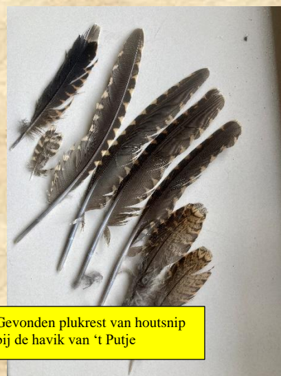
Gevonden plukrest van houtsnip bij de havik van 't Putje