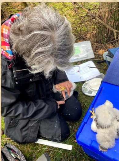
Liefdevol worden de sperwers van een ring voorzien.