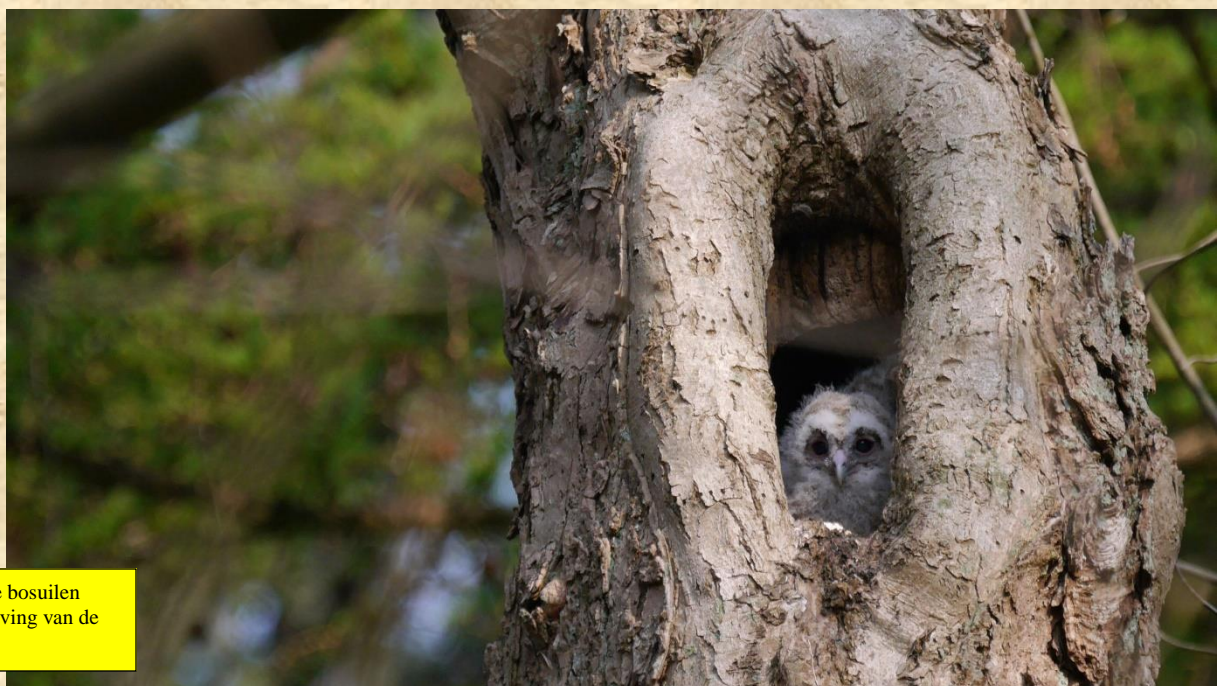
Deze prachtige foto van jonge bosuilen maakte Paul Reijns in de omgeving van de Snippenjacht Herperduin.

Buizerd, zit nog maar net op het nest. Buizerd bij Sint Wilpertiaan zit op eieren en vliegt af als wij richting nest lopen. Volgende keer meer buizerdnieuws.