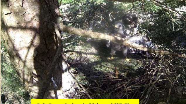
Drie jonge buizerds 30dg oud (27-5) Vierwindenbos Oss

Dit jaar wat meer naar buizerd nesten gekeken, ook de stokcamera werd gebruikt. De buizerd van het vierwindenbos had drie uitvliegende jongen. Ook is leuk dat er op de beelden prooien te zien zijn die op de nestransd liggen, veelal konijn.