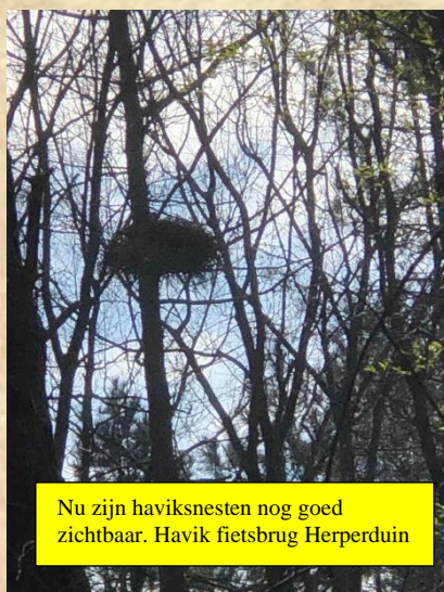
Nu zijn haviksnesten nog goed zichtbaar. Havik fietsbrug Herperduin