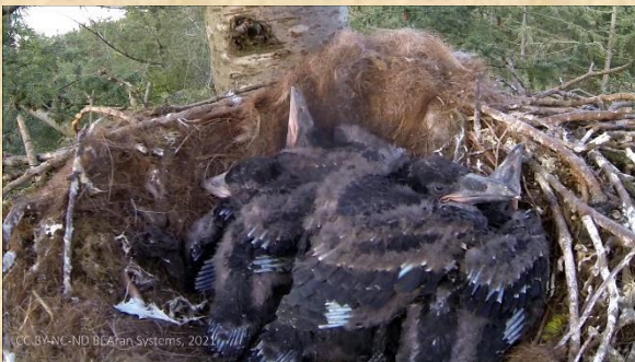
5 jonge raven van 3 weken oud Herperduin. Opname gemaakt door Arno nest op 23 meter hoogte in douglasspar. De raven worden 30 april geringd door de Ravenwerkgroep Nederland. Dan weer meer foto's.