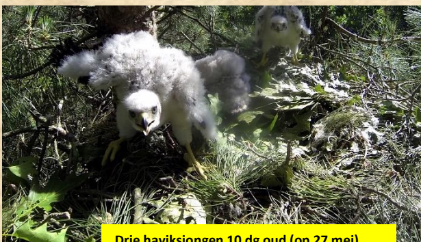
Drie haviksjongen 10 dg oud (op 27 mei) De Stelt Oss

Het zoeken naar de sperwer maar zeker ook de boomvalk en wespendif nesten vragen veel tijd. Een succesvol sperwernest met zes jongen kon geringd worden, meer hierover verder in het verslag. Als ik op de fiets zit vraag ik me af in welke belevingswereld de tegemoet komende fietser zit met zijn koptelefoon op. Ik geniet van de zang van gekraagde roodborst, zwartkoppen en roepende buizerd. Eerst nog wat oudere foto's van jonge haviken op de nesten die we in mei met de stokcamera maakten in Oss Herperduin en Maashorst-Noord. Er zit veel verschil in legbegin van de haviken zoals jullie kunnen zien in het overzichtsschema.