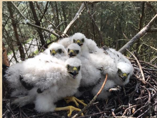
Sperwernesten zijn klein zeker als er zes jongen op zitten.