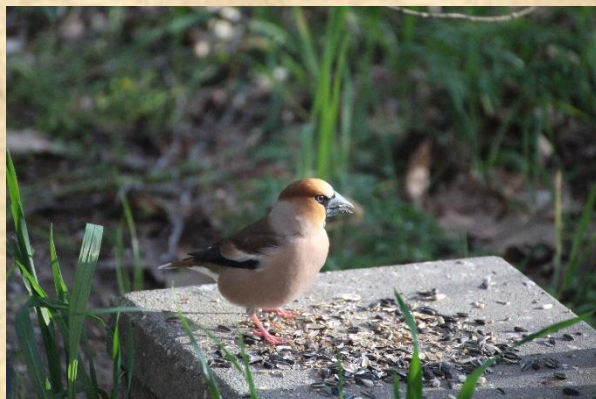
Prachtige man appelvink op de voerplank. 23 april De Stelt