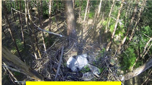
Twee buizerds donsjes 10dg oud (27-5) Naaldhof Docfalaan Oss