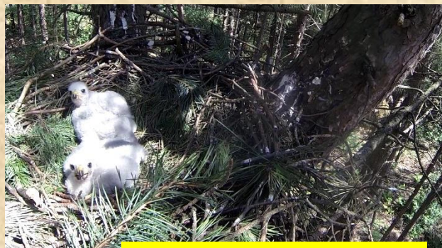
Twee haviksjongen 10 dg oud (op 29 mei) Het Putje Oss