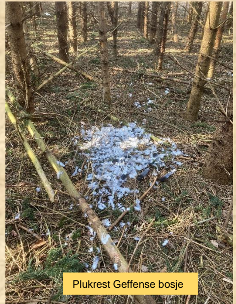
Plukrest Geffense bosje

vandaag hoorde ik gekek uit een bosperceel waar vroeger een havik zat maar nu al enkele jaren niet meer geheel verrast ben ik een tijdje blijven staan, totdat het gevoel mij bekreep dat het beest maar bleef kekken, en dat toch vrij ongewoon is en jawel hoor, het begon mij te dagen, een gaai.... die kunnen ze toch wel fantastisch nabootsen, zijn fout was dat hij overdreef!