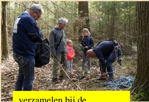
verzamenen bij de