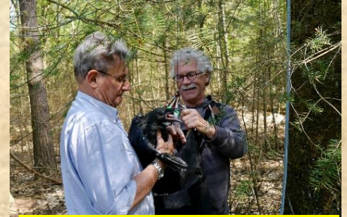
per twee jongen komen ze via de tas naar beneden