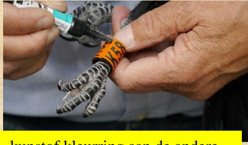
kunststof kleurring aan de andere poot, zijn van ver af beter