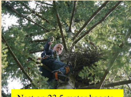
Nest op 23,5 meter hoogte