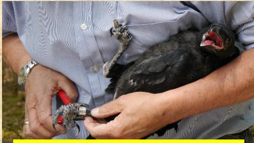
metalen VT ring aan de