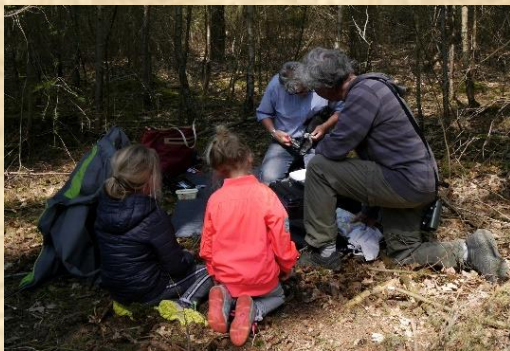
Alle aandacht tijdens het meten van vleugels en poten.