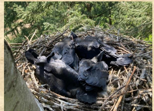
De geringde jongen liggen rustig terug in hun nest.