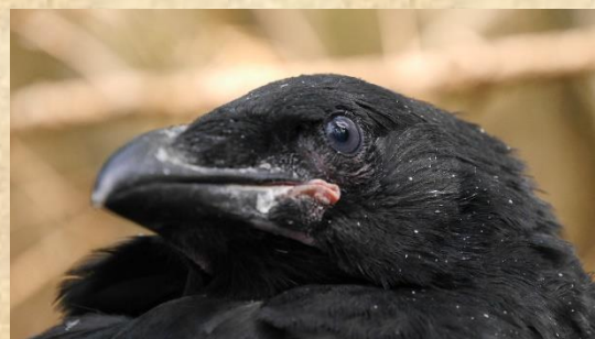
Close-up van een prachtige raven jong