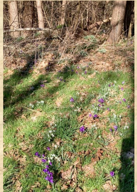
Rijsvennen sneeuwklokjes en krokusjes

Na het onstuimige weer van dagen met stormen met de namen Dudley, Eunice en Franklin nu eindelijk weer mooi lenteachtig weer. De stormschade is meestal te zien in de toppen van grove dennen die afgescheurd liggen of nog aan de stam hangen. De bosomvorming heeft nu op natuurlijke wijze plaats gevonden. Onderweg bloeiende sleedoorn op de Maashorst en in Herperduin een bedje van sneeuwklokjes en krokusjes. Ook al speenkruid dat bloeit in de slootkanten. We genieten van het voorjaar dat aan de deur klopt. Steeds meer vogelgeluiden we komen honderden sijsjes tegen in de larikstoppen, een ware invasie dit jaar. Wij zijn goedweer fietsers zeker vandaag met dit zonnig cadeau is het perfect.